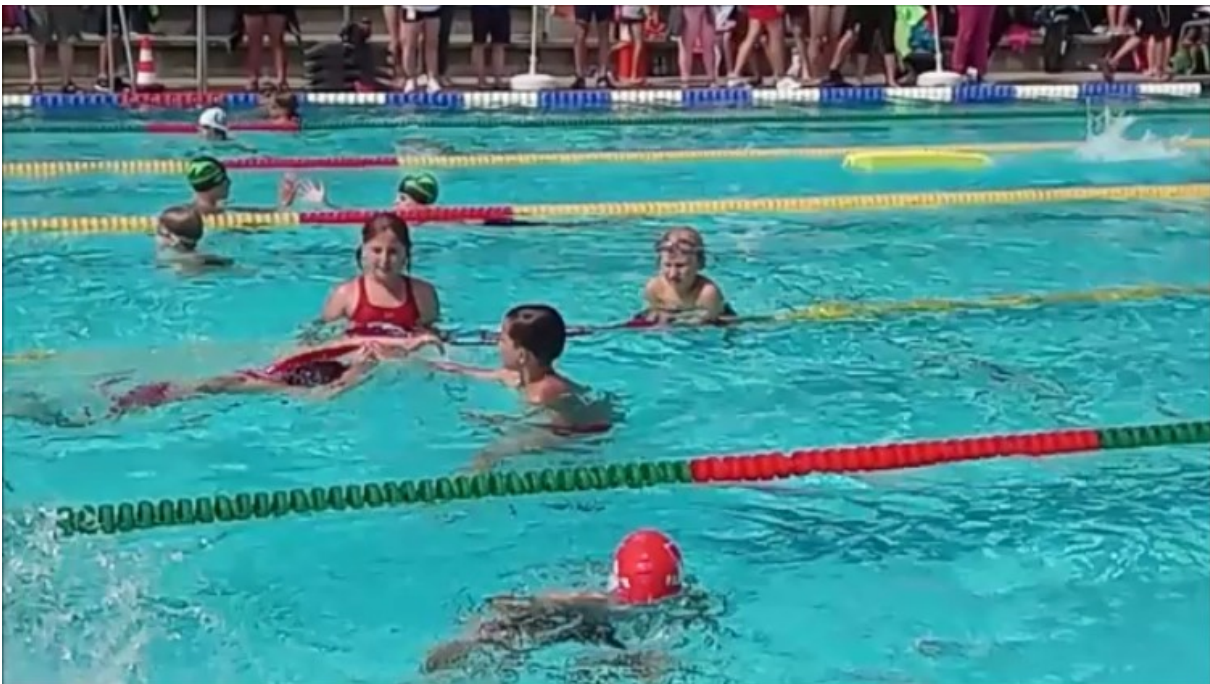
Wechselzone Übergabe Gurtretterstaffel AK 9/10

Deutsche Lebens-Rettungs- Gesellschaft e.V.